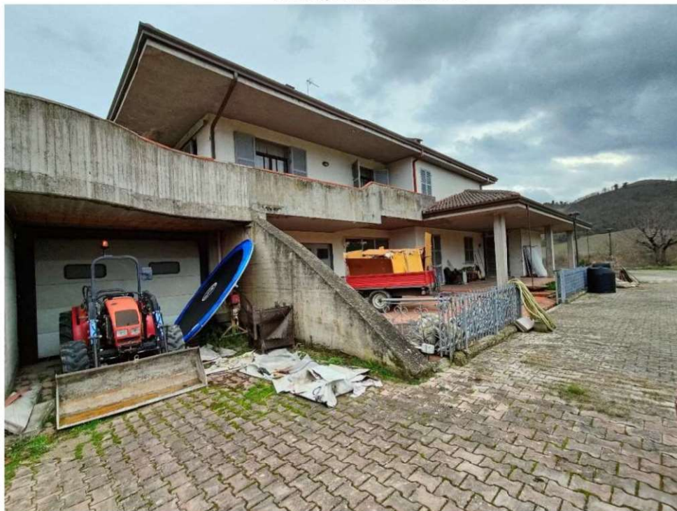
Vista della Villetta Trifamiliare