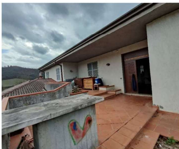
Foto 3- Vista dell'accesso all'Alloggio oggetto di esecuzione(sub.25)