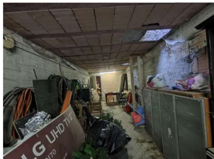
Foto 15- Vista Interno Garage Sub.19