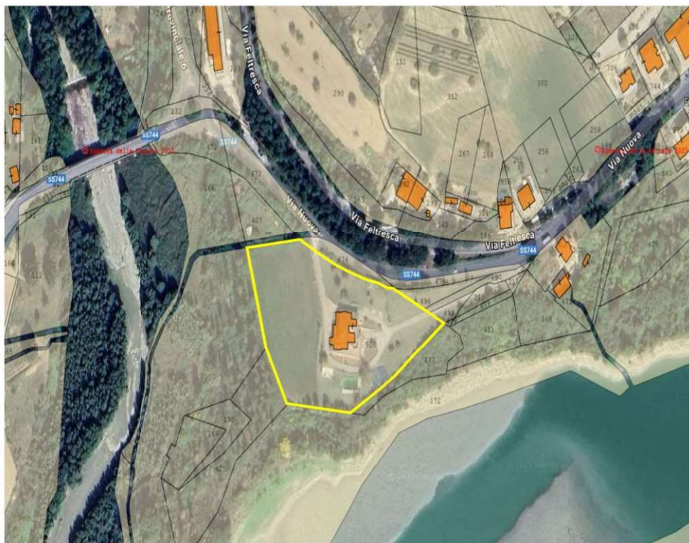
Mappa 1- Satellitare della Villetta e Corte Condominiale